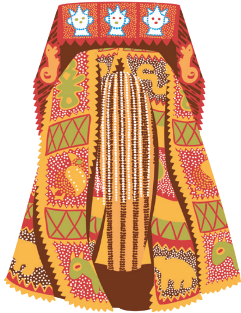
Masque Egun, ou masque des ancêtres

Les prêtres sont les intermédiaires entre dieux et humains. Ils peuvent ouvrir les portes entre le monde des esprits et celui des hommes.