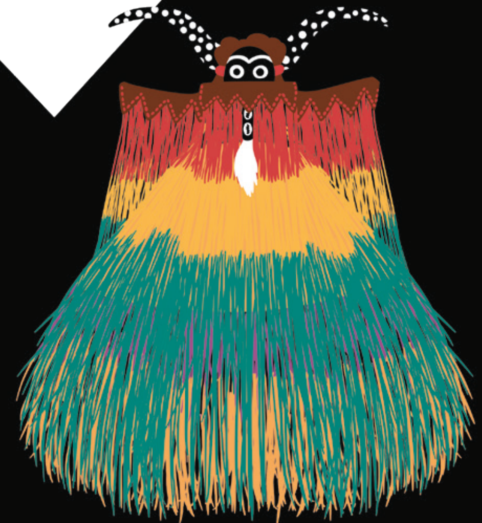
Masque de Zangbeto, gardien de la nuit

Les prêtres tracent des dessins sur le sol, les murs ou directement sur la peau. Ces dessins sont les symboles des vodous, on les appelle « vévé ».